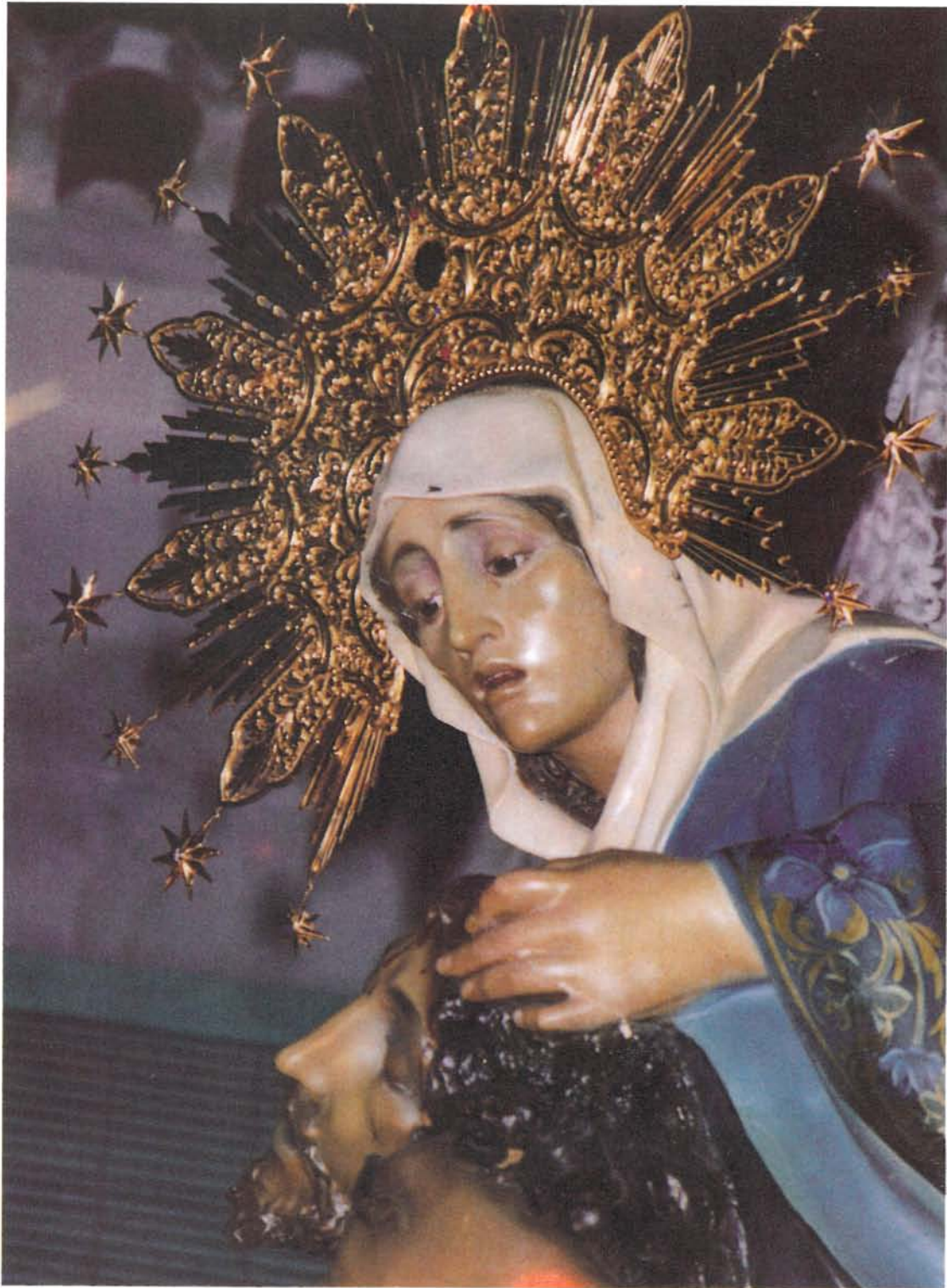
VIRGEN DE LA PIEDAD